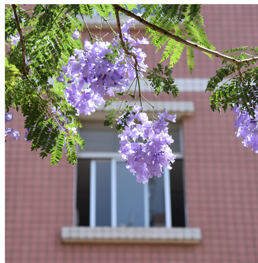
文字：朱芷萱

蓝花楹间 轻许一场约定 愿小云彩们 如夏花般绚烂予生活以热情 然后带着每一朵花的祝福 奔赴更好的未来