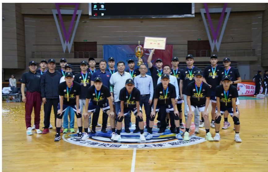
高水平男子篮球队勇夺首届七彩云南校园“三大球”超级联赛大学组篮球项目总冠军

此次西南分区赛在贵州省举办，共有来自云南、贵州、广西的27所高校240多名运动员参加。体育部