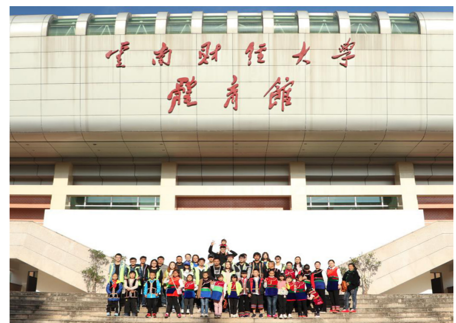
记者 谭佳 周昊 李继星 杨焱琳 宋美璇

印记。 调研团针对不同的对象（从学校的管理层到学校的老师，再到学生和家），围绕着在学校里如何开展少数民族文化教育，做了问卷调查以及访谈。随后，调研团队将两个调研报告、调研问卷以及深度访谈的录音，前后大概90份，统一打包，寄去了远“探海者”全国大学生社会实践奖组委会。