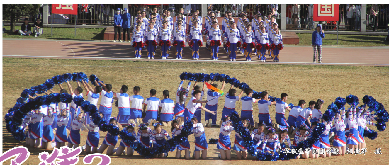
中华职业学院团体操