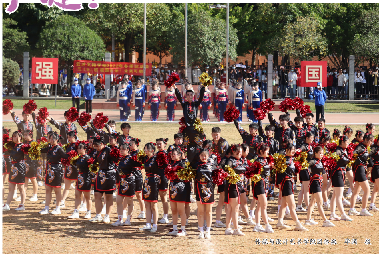
传媒与设计艺术学院团体操