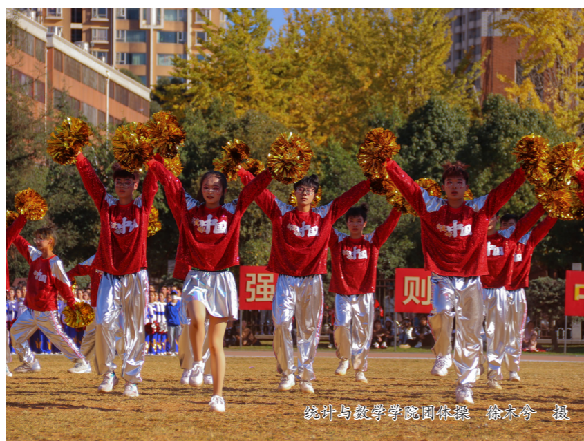
统计与数学学院团体操