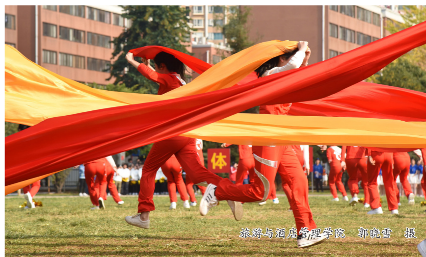
旅游与酒店管理学院 郭晓雪 摄