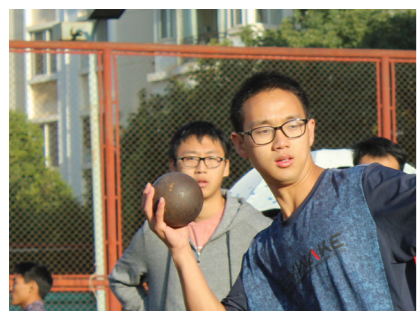
1 2 3 4