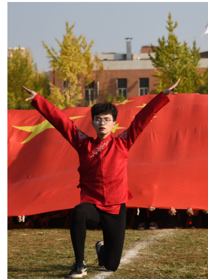
旅游与酒店管理学院 郭晓雪 摄