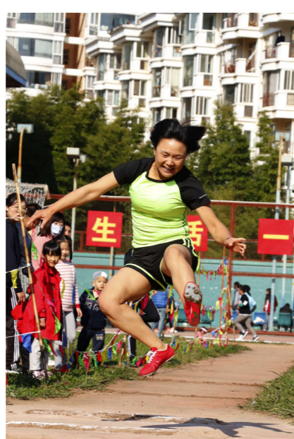
1、统计与数学学院 范兆琦 摄 2、财政与公共管理学院 宋美璇 摄 3、经济学院 彭清 摄 4、城市与环境学院 周坤阳 摄