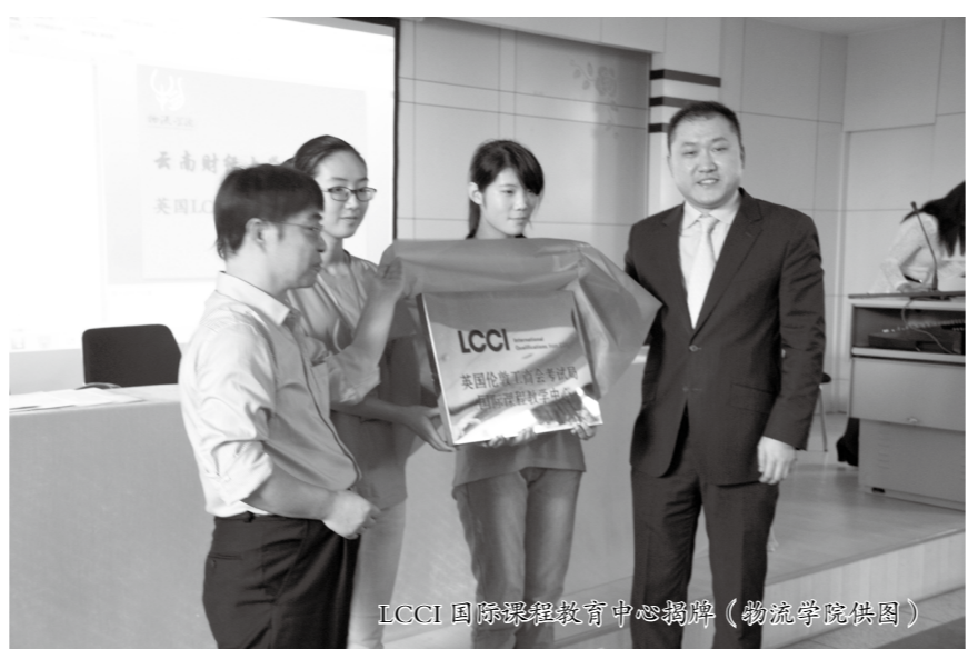
LCCI国际会计教育中心揭牌